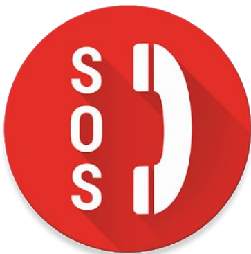
Das Logo der App im Smartphone: